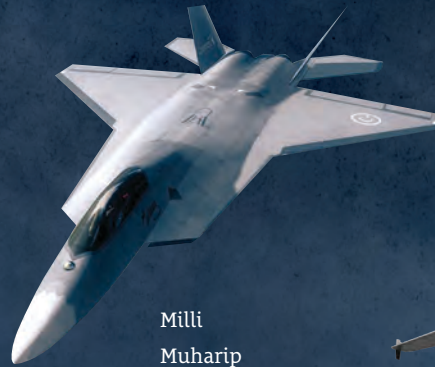
Millî Muharip Uçak

TUSAŞ tarafından dış kaynaklardan bağımsız ve özgün tasarımla yapılan hava araçlarının ilki TUSAŞ ZİU adlı zirai ilaçlama uçağıdır. Ayrıca, TUSAŞ bünyesinde helikopterlerin (GÖKBAY, T129 ATAK, T70), uçak modellerinin (HÜRKUŞ, HÜRKUŞ-C) ve insansız hava araçları sistemlerinin (ANKA, AKSUNGUR, ŞİMŞEK, TURNA) tasarlanmasına, projelendirilmesine ve üretimine devam ediliyor. Gelecekte F-16 uçaklarının yerini alabilecek, yurt içi imkân ve kabiliyetler ile tasarlanan ve geliştirilen bir savaş uçağının üretilmesi, ayrıca bu uçağı tasarlayıp geliştirebilecek insan gücü ve altyapının oluşturulması amacıyla başlatılan Millî Muharip Uçak (MMU) Geliştirilmesi Projesi de devam ediyor.