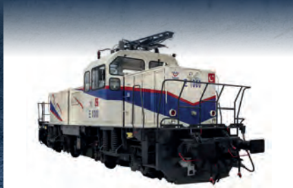
E1000 Elektrikli Manevra Lokomotifi

Karsan ve Adastec'in ortak çalışmalarıyla geliştirilen Otonom Atak Electric, gücünü 220 kWh kapasiteli bataryalardan alıyor. Seviye 4 otonom özelliklerine sahip elektrikli otobüsün motoru 230 kW güce ulaşarak 2.500 Nm tork üretebiliyor. Otobüsün 8,3 m'lik uzunluğu, 52 kişinin üzerinde yolcu kapasitesi ve 300 km'lik menzili de Otonom Atak Electric'i sınıfta öncü konuma getirdi. Ticarileşmiş seri üretimlerden iki tanesinin Romanya ve ABD'ye gönderilmek üzere yurt dışı sipariş anlaşmalarının tamamlandığı belirtiliyor. Bu elektrikli otobüslerin ilk etapta servis aracı olarak kullanılması öngörülüyor.