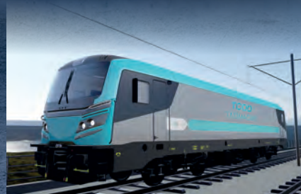
E5000 Elektrikli Anahat Lokomotifi

Yerli ve milli imkânlarla üretilen Türkiye'nin TSI sertifikasına sahip ilk elektrikli anahat elektrikli lokomotif olan E5000, minimum 5000 kW güce sahip, AC-AC tahrik sistemli ve 140 km/s hıza sahip yeni nesil bir lokomotif. Treninin dış kapıları ise elektrik gücüyle açılıp kapanacak şekilde elektromekanik olarak tasarlandı. Trenin hızlanma, yavaşlama, durma, kapı kontrolü, yolcu geçişleri ve ışıklandırma gibi işlevlerinin yönetildiği tren kontrol