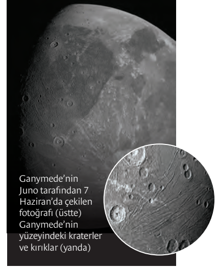
Ganymede'nin Juno tarafından 7 Haziran'da çekilen fotoğrafı (üstte) Ganymede'nin yüzeyindeki kraterler ve kırıklar (yanda)

NASA tarafından yayımlanan fotoğraflarda uydunun yüzeyindeki kraterler dikkat