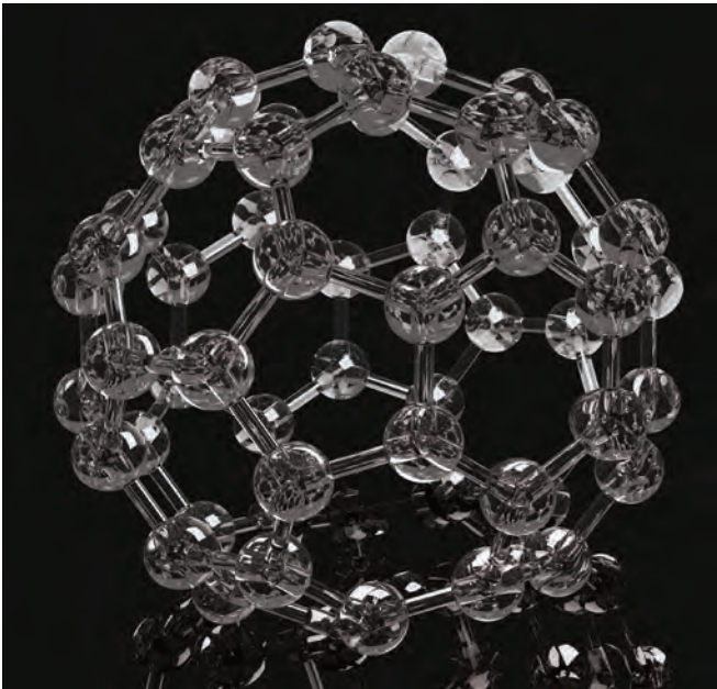
Bucky küresi. Karbon atomlarının nanometre ölçeğinde oluşturduğu karmaşık yapıların bir örneği. Bucky küresi 60 karbon atomundan oluşur.