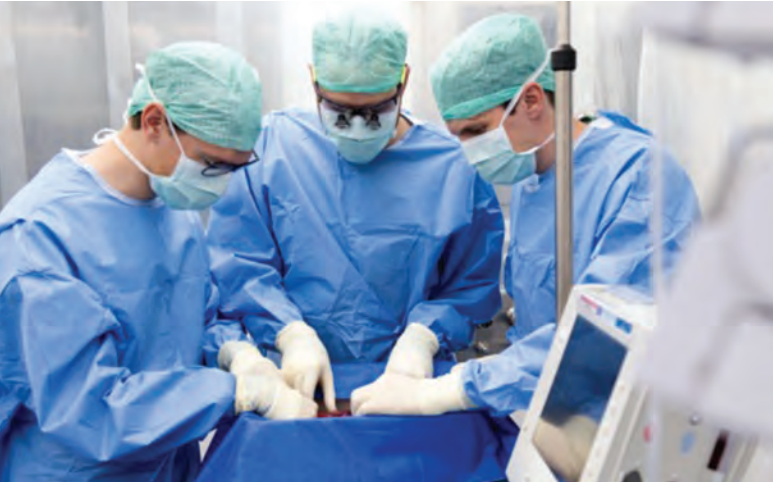
Nakledilecek karaciğer perfüzyon makinesine bağlanıyor.

Geliştirilen perfüzyon makinesi insan vücudunu taklit ediyor. Cihazda kalp, akciğer ve böbrek işlevi gören parçalar var. Makineye bağlanan organlar, içerisinde pankreas ve ince bağırsak tarafından salgılanan çok sayıda hormon ve gıda bulunan bir sıvıyla besleniyor. Ayrıca cihaz, insan vücudundaki diyafram kası gibi, organları ritmik olarak hareket ettirebiliyor.