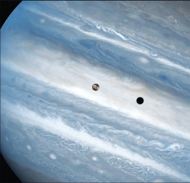
Jüpiter ve Uydusu Io (1999)

Bu Hubble görüntüsünde amatör gökbilimciler arasında popüler bir hedef olan Horsehead Bulutsusu kızılötesi dalga boylarında görülüyor. Görünür ışık dalgaboylarında gölgeli görünen bulutsu, kızılötesi dalgaboylarında şeffaf ve uhrevi bir görüntü sergiliyor. Görüntü farklı dalgaboylarına farklı renkler atanarak suni olarak renklendirilmiş.