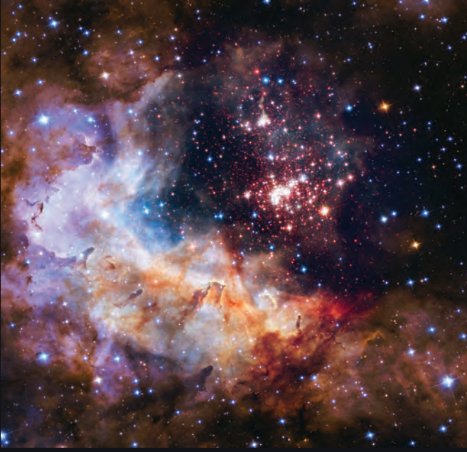
Westerlund 2 (2015)

Hubble 'ın 25. yılını şerefleştiren bu görüntünün merkezdeki parlak kısmında 3000 yıldızdan oluşan Westerlund 2 adlı dev bir yıldız kümesi görülüyor. Westerlund 2, Gum 29 olarak bilinen yıldız oluşum bölgesinde yer alıyor. Sadece yaklaşık 2 milyon yaşındaki bu dev yıldız kümesi gökadamızın en sıcak, en parlak ve büyük kütleli yıldızlarından bazılarını barındırıyor.