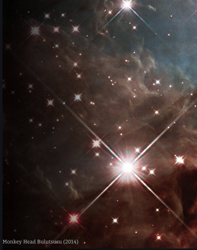
Monkey Head Bulutsusu (2014)

Hubble 'ın optik yapısı, Ritchie-Chretien Cassegrain türü bir tasarım olarak planlandı. Teleskobun ana ya da ilk aynasına vuran ışık, birincil aynanın üzerine sarkıtılan daha küçük ikincil bir aynaya yansıtılıyor. İkincil ayna da ışığı birincil aynanın ortasında yer alan bir delikten içeri gönderiyor ve ışık Hubble 'ın alıcılarına (kamaralar ve spektrograflar) girip kaydediliyor.