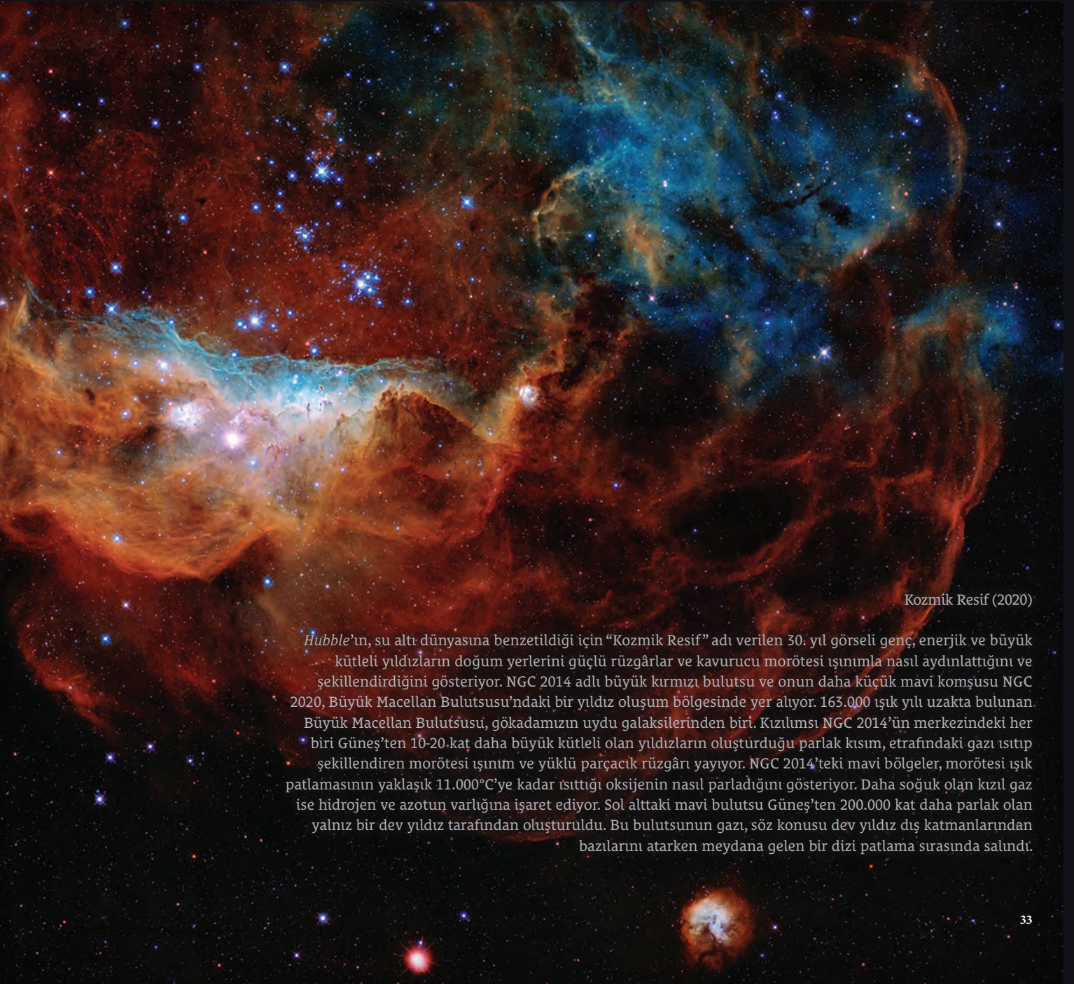
Kozmik Resif (2020)

ders kitaplarını dolduruyor. Hubble şimdiye kadar toplam yaklaşık 47.000 gök cismine dair toplam 1,4 milyondan fazla gözlem yaptı. Keşiflerine ve gözlemlerine dayalı olarak 17.000'den fazla hakemli bilimsel yayın yapılması, bu teleskobun bilimsel açıdan gelmiş geçmiş en verimli uzay gözlemevi olduğu anlamına geliyor. Hubble 'ın arşiv verileri gelecek nesillerin gökbilim araştırmaları için de malzeme sağlamaya devam edecek.