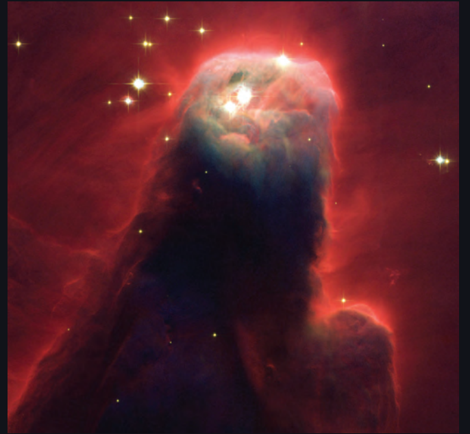
Cone Bulutsusu (2002)

Hubble , Jüpiter'in uydusu Io'yu gezegenin devasa yüzeyinin önünden geçip gölgesini onun üzerine düşürdüğü bir anda gösteren bu görüntüyü, Io'daki volkanik dumanları görüntülemeye çalışırken yakaladı. Bu, ikilinin Hubble 'ın 9. yaş günü şerefine yayımlanan üç etkileyici görüntüsünden biriydi.