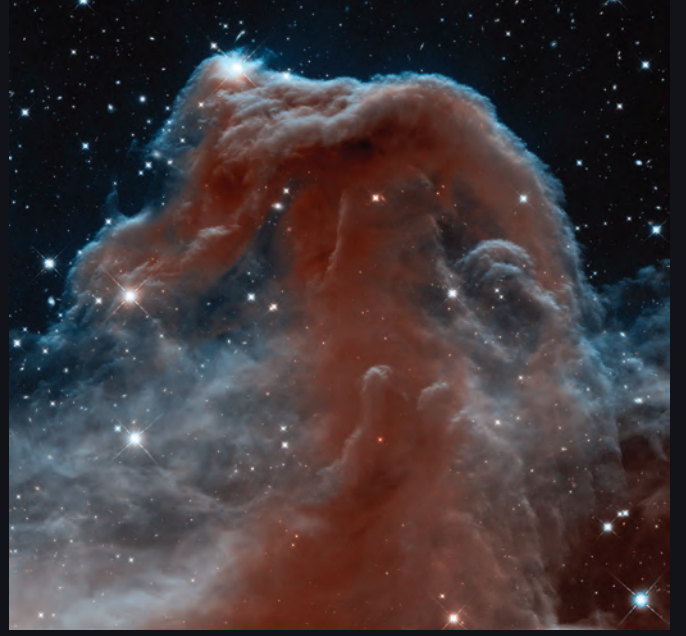
Kızılötesi Işıktaki Horsehead Bulutsusu (2013)

Hubble 'ın 25. yılını şerefleştiren bu görüntünün merkezdeki parlak kısmında 3000 yıldızdan oluşan Westerlund 2 adlı dev bir yıldız kümesi görülüyor. Westerlund 2, Gum 29 olarak bilinen yıldız oluşum bölgesinde yer alıyor. Sadece yaklaşık 2 milyon yaşındaki bu dev yıldız kümesi gökadamızın en sıcak, en parlak ve büyük kütleli yıldızlarından bazılarını barındırıyor.