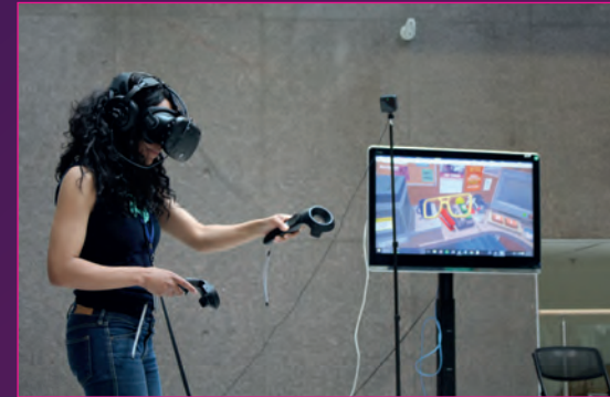
Hololens 2 kaskı ile artırılmış gerçeklik uygulaması

Sanal gerçeklik, gerçek dünyanın veya içindeki nesnelerin eksiksiz 3 boyutlu sanal temsillerini ifade eden bir kavram ve bu yüzden artırılmış gerçeklikten farklıdır. Artırılmış gerçeklikte geleneksel bir bilgisayar, cep telefonu, tablet veya gözlükler ile kullanıcı çevresine baktığında bulunduğu ortamı görmeye devam eder ve hâlâ gerçek dünyada olduğunun farkındadır. Hâlbuki sanal gerçeklik kullanıcıların çevrelerindeki somut gerçeklikten farklı bir gerçekliği deneyimlemelerini amaç-