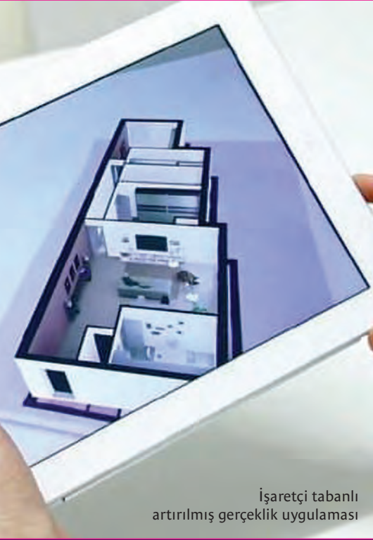
İşaretçi tabanlı artırılmış gerçeklik uygulaması