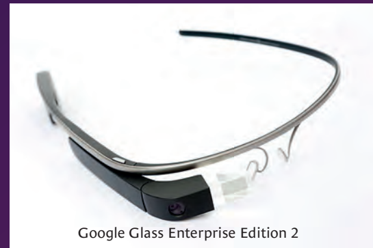
Google Glass Enterprise Edition 2

Google'ın ürettiği Google Glass artırılmış gerçeklik ürünü olarak 2013'de piyasaya sürüldüğünde herkesi heyecanlandırdı fakat son kullanıcı versiyonu beklenen ilgiyi göremedi. Firma 2015 yılında Google Glass'ı yeniden yapılandırma kararı aldı ve yeni modelin kurumsal müşterilere odaklanmasına karar verdiğini duyurdu. 2019 yılında fiyatı 999 dolar olarak belirlenen Google Glass Enterprise Edition 2 resmen duyuruldu. HoloLens 2 ise Microsoft'un Kasım 2019'da piyasaya sürdüğü, devrim niteli-