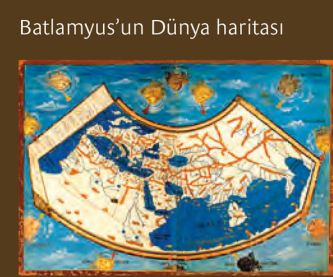
Batlamyus'un Dünya haritası

Batlamyus coğrafi koordinatları ve konik harita projeksiyonunu kullanarak ilk evrensel atlası oluşturdu.