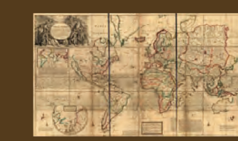
1719'dan kalma bir Dünya haritası

Tiziz bilimsel yaklaşımların benimsendiği bu dönemde hassas ölçüm aletlerinin geliştirilmesi ve keşifler sayesinde yeni haritalar üretildi. Ayrıca Dünya'nın boyutları yeniden ölçüldü.