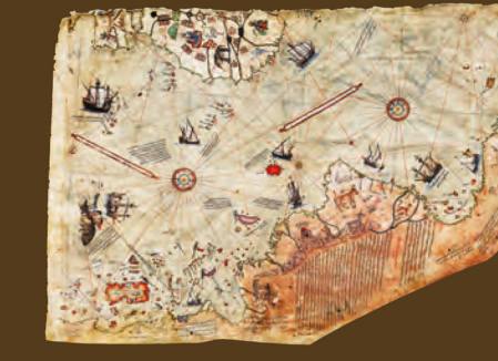
Piri Reis'in Avrupa ve Afrika'nın batı kıyılarıyla Güney Amerika'nın doğu kıyıları gösteren 1513 tarihli Dünya haritası.

Osmanlı kaptanı-ı deryası (amiral) Piri Reis Kitab-ı Bahriye adlı kitabında denizcilik haritaları yayımladı.