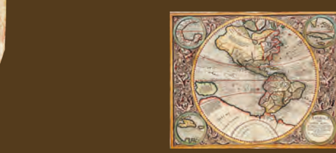
Mercator tarafından çizilen Amerika haritası

Gerardus Mercator adlı haritacının geliştirdiği Mercator projeksiyonu yaygın olarak kullanılmaya başlandı.