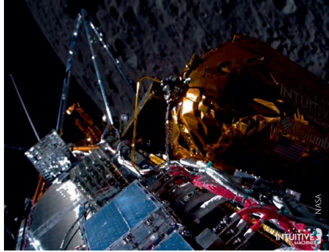
Odysseus'un 27 Şubat'ta Ay'ın yüzeyinden aldığı görüntü

Odysseus, özel şirketlere ait görev yüklerinin yanı sıra NASA tarafından gelecekteki insanlı ya da robotik Ay görevlerinde kullanılmak üzere geliştirilen altı bilimsel ve teknolojik cihaz taşıyor. NASA, görev sırasında Ay'ın yüzeyine yumuşak