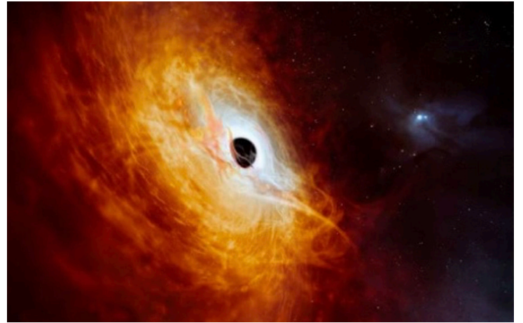
Kuasar J059-431'in temsili görüntüsü (ESO)

Kuasarlar, gök adalarının merkezlerinde yer alır ve etraflarında madde