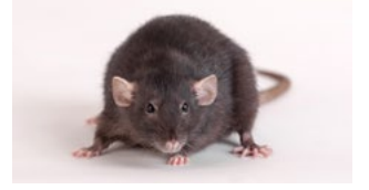
Morris su labirenti (altta)

Dört hafta boyunca loş ışığa maruz bırakılan sıçanlar bir ay dinlendirildikten sonra, bu defa dört hafta boyunca parlak ışığa maruz kaldıklarında beyin kapasitelerinin ve